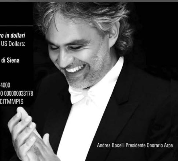
Andrea Bocelli Presidente Onorario Arpa

Bonifici bancari dall'Italia: Monte dei Paschi di Siena Gruppo MPS c/c 2408730 ABI 01030 - CAB 14000 IBAN: IT 15 N 01030 14000 000002408730